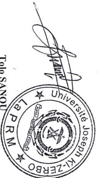
Chevalier de l'Ordre des Palmes académiques